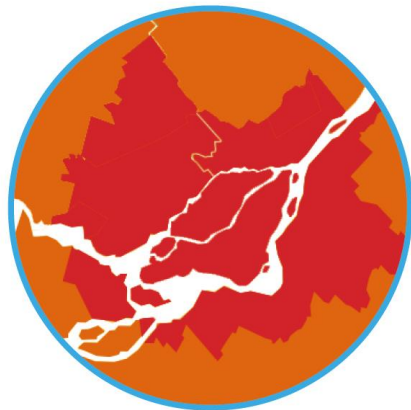
Capitale-Nationale et environs