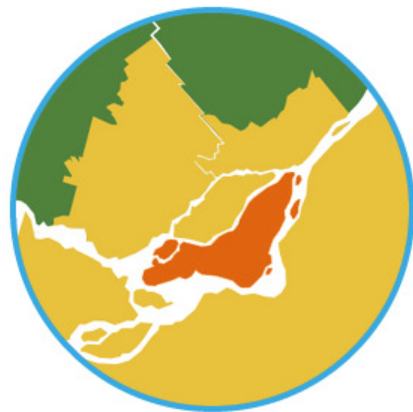
Montréal et environs