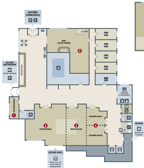
Plan de salles | REZ-DE-CHAUSSEE Ground floor